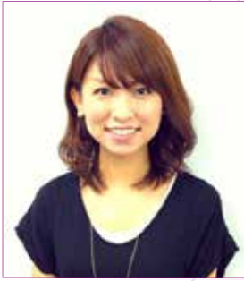
株式会社サイバーエージェント・クラウドファンディング取締役